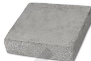
Placă pereu PP1